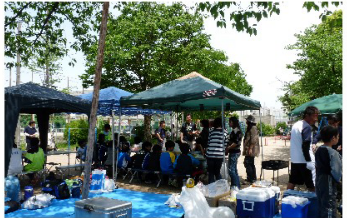
「準備OK! さあ、始まるゾ!」 (朝から場所取り、ご苦労さまでした)